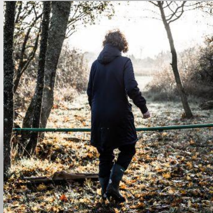
Intervention und Bewältigung